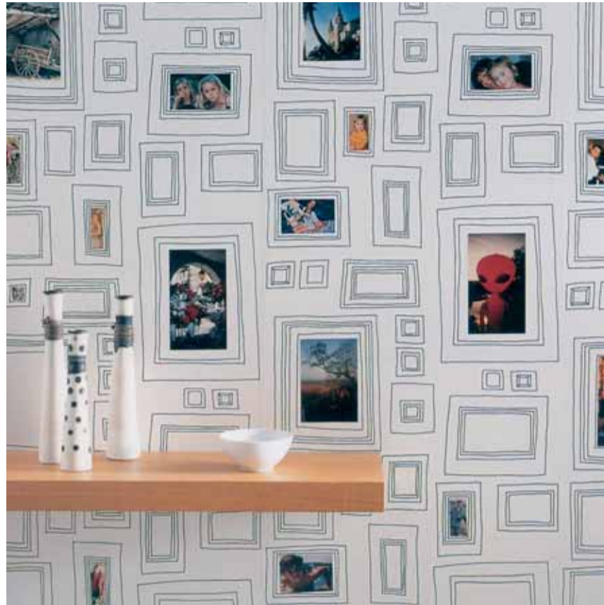
Seinal saab uhkelt eksponeerida oma perekonnafotosid.

Tuleb arvestada kujundatava ruumi suurust, lae kõrgust, loomuliku valguse olemasolu ja langemist, tulevase mööbli hulka. Korralik eeltöö ehk oma eelistuste rahulik väljaselgitamine, ma-